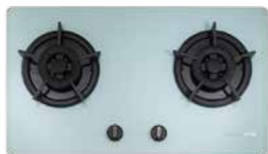
G2522AG 二口小面板 易清檯面爐