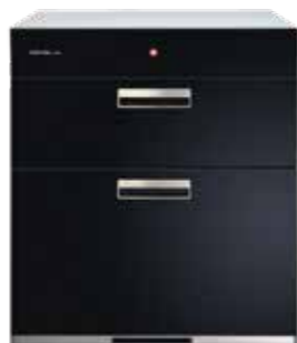
Q7693 全平面玻璃觸控 落地式烘碗機